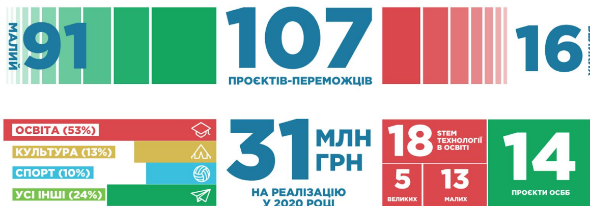
Рис. 2. Результати загальноміського голосування за проекти бюджету участі у 2019 році

Результати бюджету участі Дніпра та перелік проектів переможців затверджені розпорядженням міського голови від 12.12.2019 № 1978-р «Про затвердження списку проектів-переможців з партиципаторного бюджетування (бюджет участі) у м. Дніпрі у 2019 році»